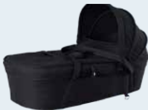
Capazo Negro 90000403