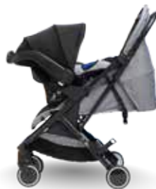
Silla de coche