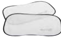
Protector de sol