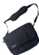
Bolso Cambiador 90100703