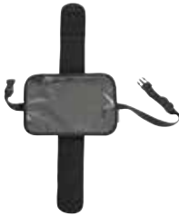
Funda soporte tablet

Las fundas protectoras iKidz se han diseñado especialmente para las sillas Axxkid Minikid, Move, sin aberturas innecesarias. Disponen de aberturas laterales, con velcro, para el sistema de protección ASIP, así como aberturas para la correa del arnés. Material 95% algodón y 5% elastán.