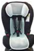
Funda protectora transpirable

Fácil de fijar en la ventana trasera gracias a su ventosa. Ahora en castellano para señalar el sistema a contramarcha.