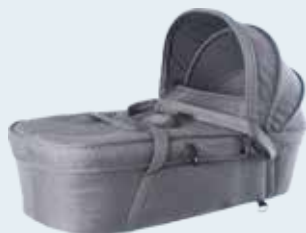
Capazo Gris 90000403