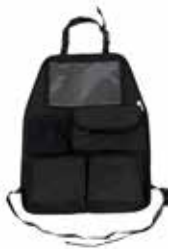
Organizador funda asiento

Correas de sujeción extras, ideal para la instalación de tu silla a contramarcha en un segundo coche. Evitan el efecto rebote en un posible accidente.