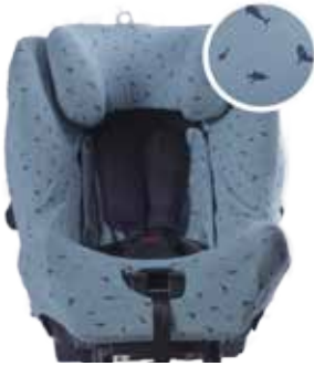
Azul estampado tiburón Z301032