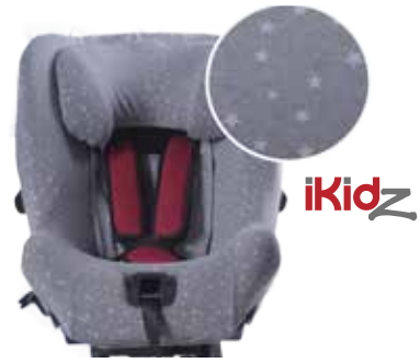
Gris estampado estrellas Z301030