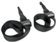
Correas de sujeción para Axkid Move

Protege los asientos del coche del uso y la suciedad. Válido tanto para coches que disponen de ISOFIX o no.