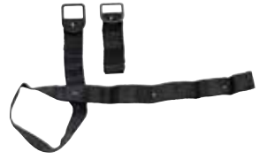
Correas de sujeción inferiores

La cuña ayuda a rellenar el hueco entre la silla de seguridad y el asiento del vehículo donde va instalada la silla, cuando este último es muy inclinado. Válida para todos los modelos.