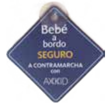
Señal de bebé a bordo a contramarcha

Accesorio que permite sostener el Ipad o dispositivo electrónico. Se sujeta al reposacabezas del coche.