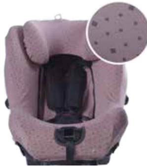
Rosa estampado geométrico Z301031