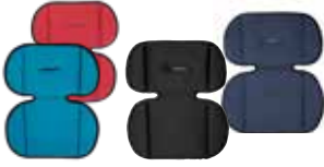
Cojín adaptador para sillas

Cojín suave para dar a los más pequeños mejor protección lateral. El cojín eleva al niño para mejorar la posición del arnés. Válido para todas nuestras sillas grupo 1/2.