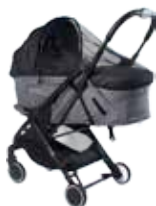
Mosquitera Capazo 90100606