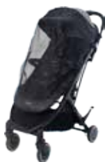
Mosquitera para Silla 90000506