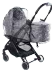
Protector lluvia para Capazo 90000314