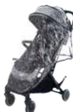
Protector lluvia para Silla 90000214